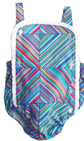
Ranita Rayita de colores