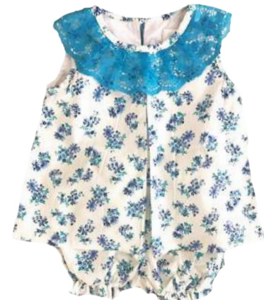
Cojunto Renata Blu