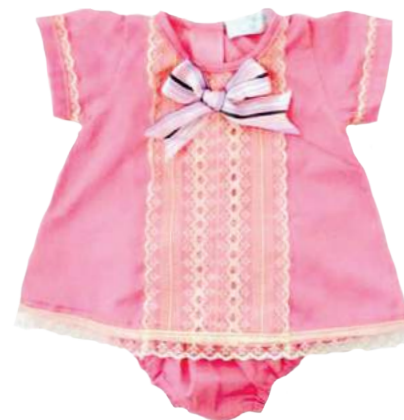
Cojunto Ciccia Rosa