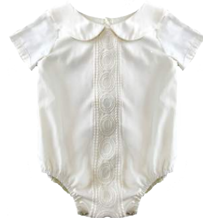
Pelee Dulzura de Algodón