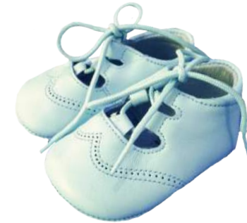
Zapatos para Bebés

★ Combina los diferentes estilos que hay para ellos. Pregunta por nuestras tallas y colores disponibles.