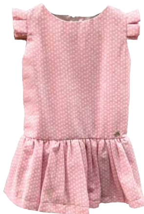
Vestido Rosa Lunares