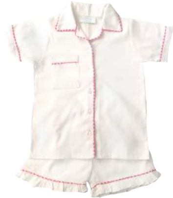
Camisa + short blanco con ruffles y detalles a color