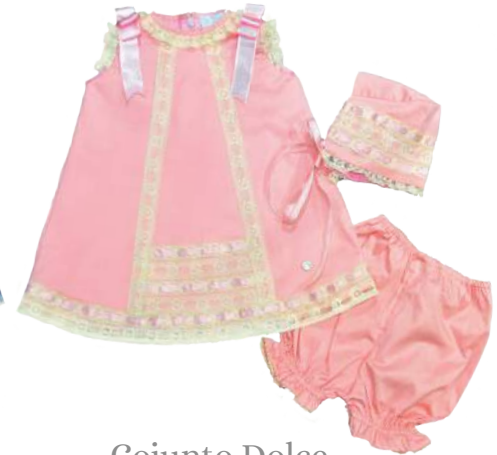
Cojunto Dolce rosa con encaje