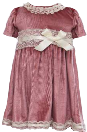
Vestido Velvet Rosado