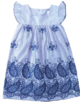
Vestido Mintina Azul