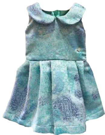
Vestido Flora Nite