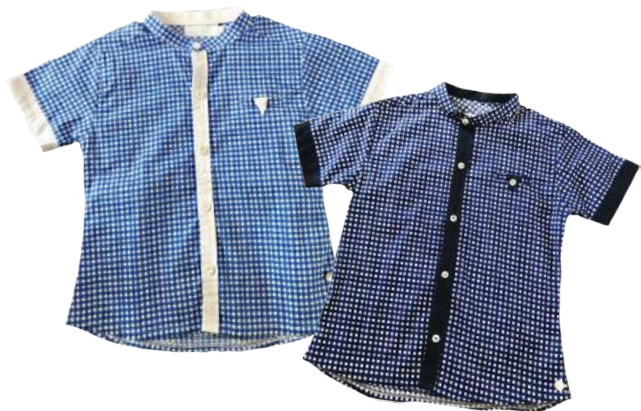
Camisas en cuello liki-liki estampadas