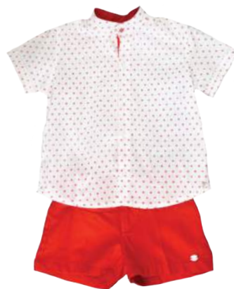
Camisa liki-liki estampada + bermuda roja