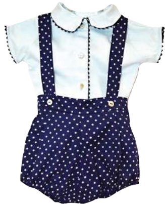
Cojunto Calzoni Pallina Blu con cargadores