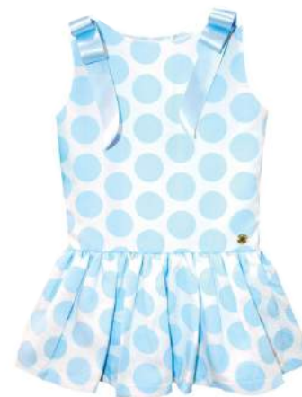
Vestido Mina Blu