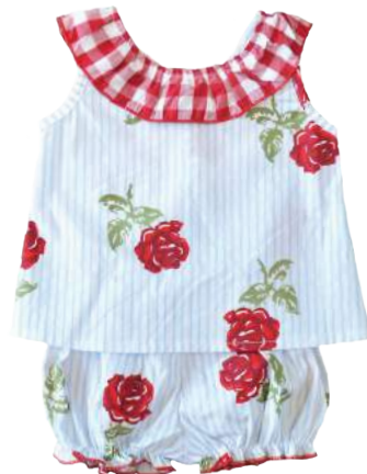
Cojunto Fiori Piccolina