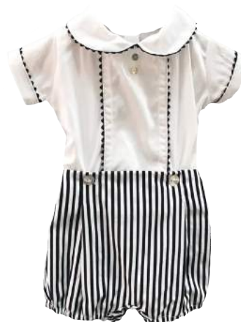
Conjunto Bimbo rayas azul