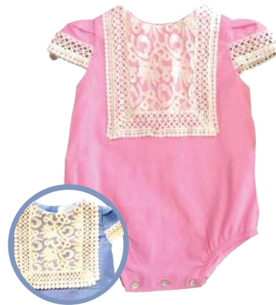
Pelee Bambola Rossa