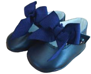
Muñeca con lazo en falla