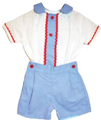
Cojunto Bimbo Blu