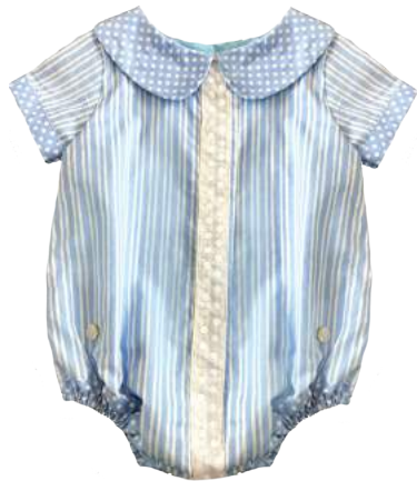
Pelee Blu Stripes

¡Disponibles en diferentes estilos y estampados!