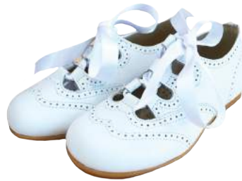
Clásicos Españoles con cinta de amarrar