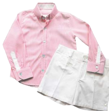
Camisa rosa manga larga + bermuda blanca