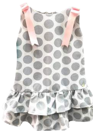
Vestido Mina Gris