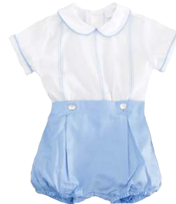
Cojunto Bordado con tres líneas