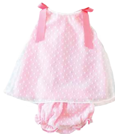
Cojunto Rosa con cintas