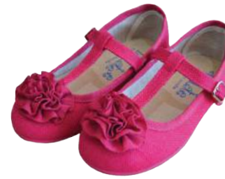
Merceditas con lazo frontal