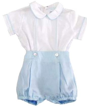
Cojunto Bordado con dos líneas