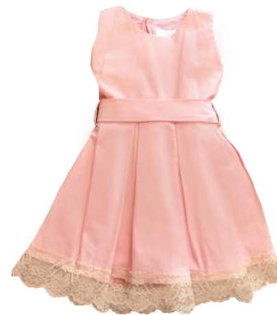
Vestido Dolce Rosa