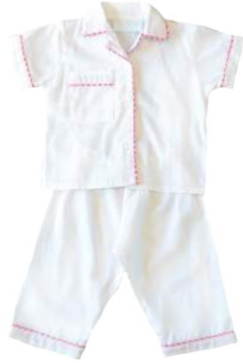
Camisa + pantalón blanco con detalles

★ Puedes personalizarlas con inicial o nombre bordado.