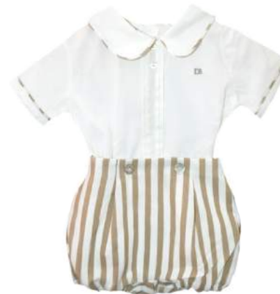
Conjunto Bimbo rayas camel