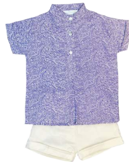
Cojuntos Camisas en cuello liki-liko + Bermuda