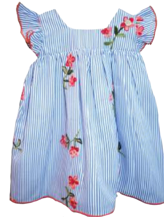
Vestido Mintina Rosa