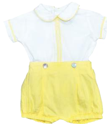
Cojunto Bordado con detalle en el centro