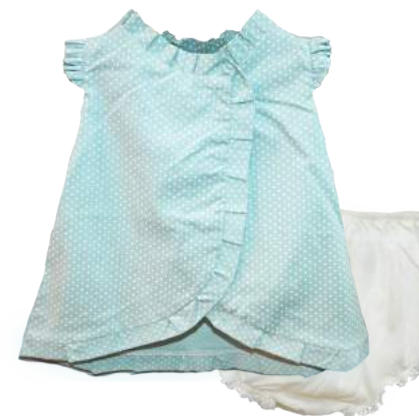
Vestido Martina Polkadots