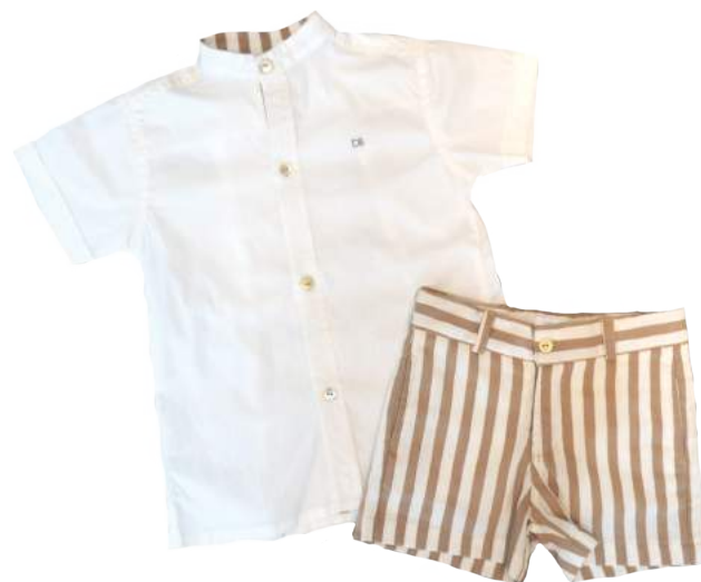
Cojunto Bermuda Rayas + Camisa