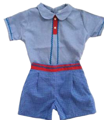
Cojunto Bimbi Rossini