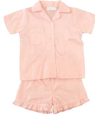
Camisa + short de color con ruffles