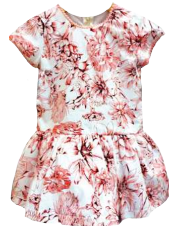
Vestido Fiorella Rosa