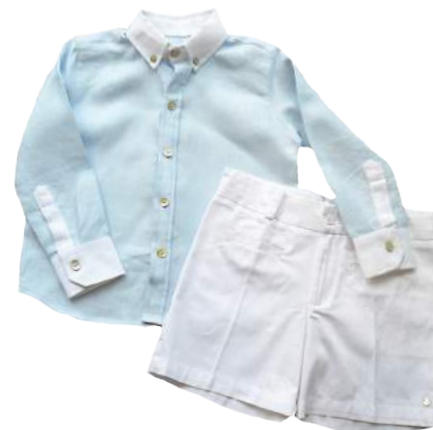
Camisa azul en lino manga larga + bermuda blanca