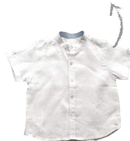
Camisa Blanca lino en cuello liki-liki