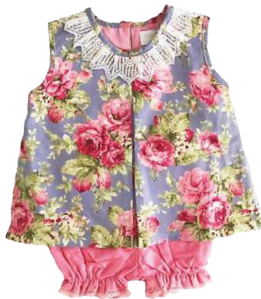
Cojunto Renata Rosa