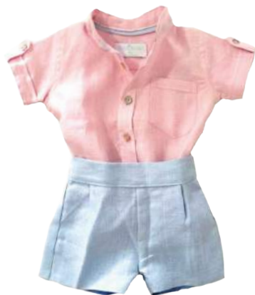
Camisa Rosa lino + Bermuda azul lino