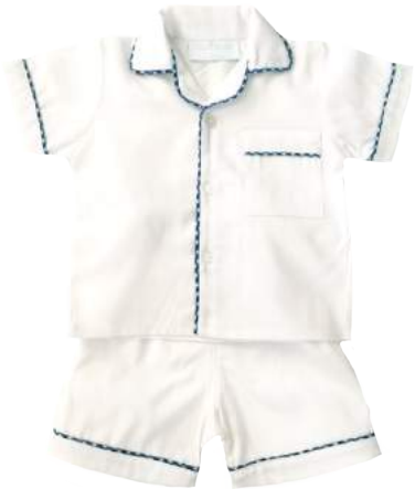
Camisa + short blanco con detalles a color