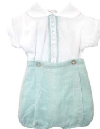
Cojunto Bimbi Menta