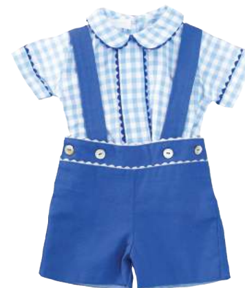
Cojunto Cometa Blu