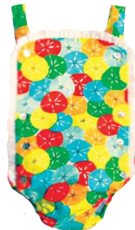
Ranita Ranita Festa