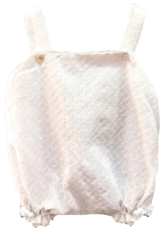
Pelee San Remo