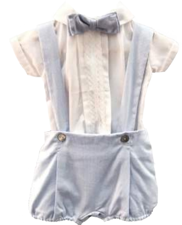
Cojunto con cargadores y corbatín