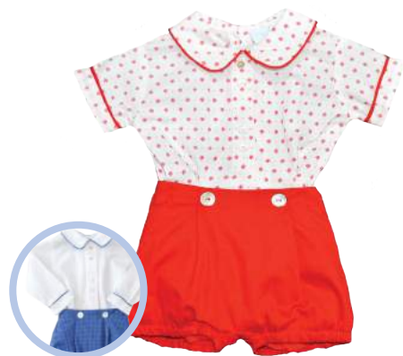
Cojunto con cuello rojo