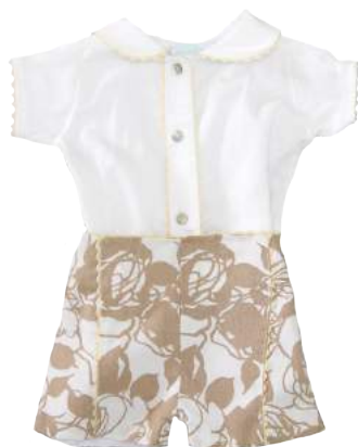
Cojunto Arena Bianca