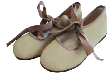
Angelito Serratex con lazo