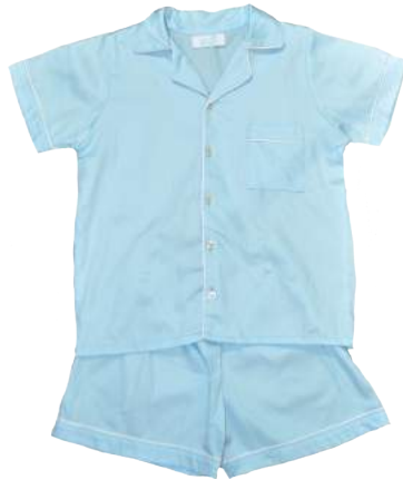
Camisa + short de color