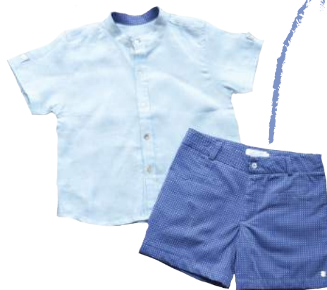
Camisa Azul en cuello liki-liki + bermuda