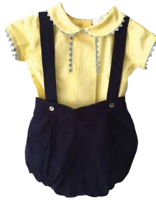
Cojunto Calzoni Giallo