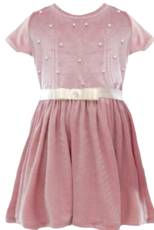
Vestido Velvet Rosa con Perlas