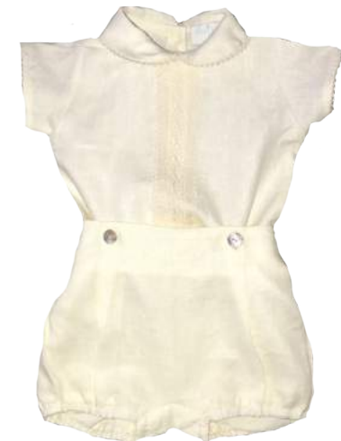
Bautizo Lino Vainilla