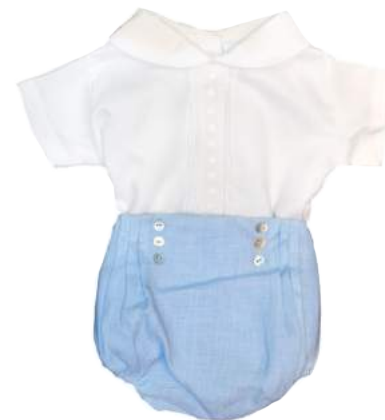
Calzoni + camisa con detalle en centro y cuello