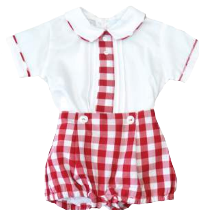
Cojunto con cuello y detalle en el centro