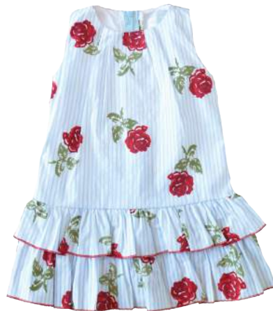
Vestido Fiori Bambina