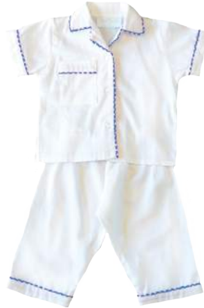
Camisa + pantalon blanco con detalles