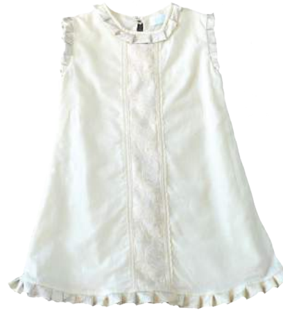
Vestido San Remo