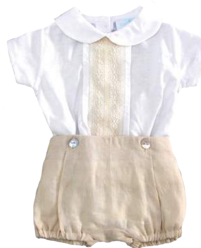
Bautizo Lino con Encaje