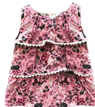
Vestido Mora con Boleros