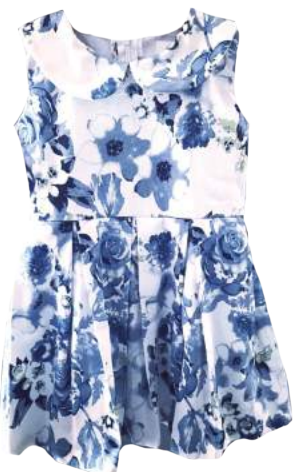
Vestido Allegra Blu