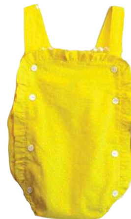
Ranita Ranita Sole