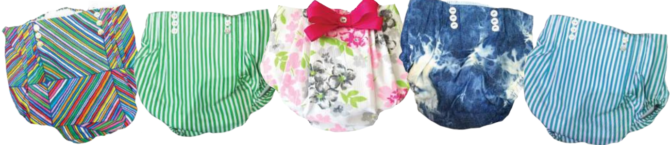
Calzoni Rayas de colores